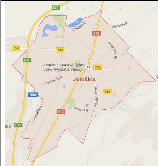
1 pav. Joniškio miesto teritorijos ribos.

Joniškio miestas – Joniškio rajono savivaldybės centras. Miesto teritorija yra nedidelė, užima 895 ha plotą (Joniškio rajono savivaldybės plotas – 115 200 ha).