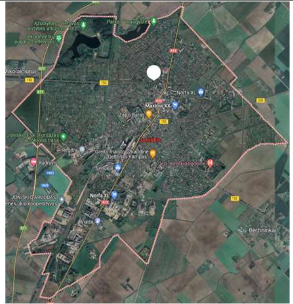
2 pav. Joniškio miesto teritorijos ribos.

Joniškyje išplėtotas žemės ūkio sektorius – žemės ūkio produkcijos gamyba, perdirbimas, prekyba. Žemės ūkio naudmenos užima net 72,2 proc. Joniškio rajono teritorijos. Tai atskleidžia, kad didžioji dalis ekonominių veiklų yra susikoncentravusi rajone ir kaimiškose vietovėse, kas iš dalies turi neigiamą įtaką miesto vystymuisi ir plėtrai.